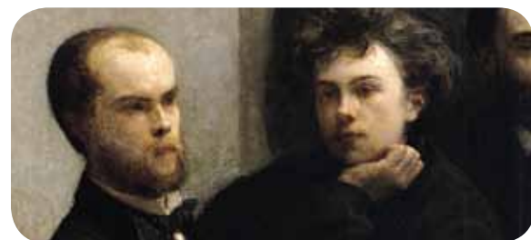
Paul Verlaine et Arthur Rimbaud