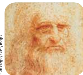
Léonard De Vinci et Salai