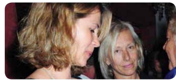
Julia Lemigova et Martina Navratilova