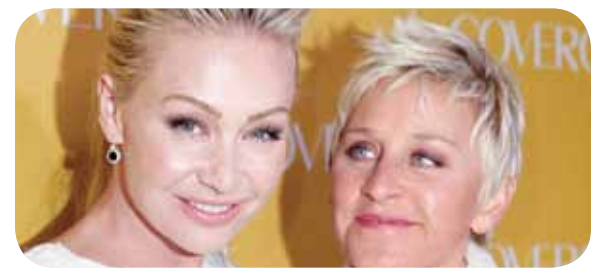
Portia De Rossi et Ellen DeGeneres